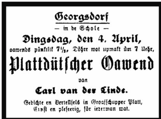
Abb. 5: Anzeige für einen „Plattdütschen Oawend“ in Georgsdorf im Frühjahr 1922. Quelle: Zeitung und Anzeigebblatt Nr. 50 vom 31.3.1922.